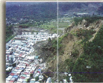
Ang landslide sa Cherry Hills Subdivision ng Antipolo, Rizal noong Agosto 1999 ay nangyari makalipas ang malakas at tuloy-tuloy na pag-ulan.

Ang mga lugar na may matarik na dalisdis at mahihinang uri ng bato at lupa sa dalisdis ay maaaring magkaroon ng landslide kapag may malakas o tuloy-tuloy na pag-ulan ( rain-induced landslide ), o di kaya pagyanig mula sa lindol ( earthquake-induced landslide ).