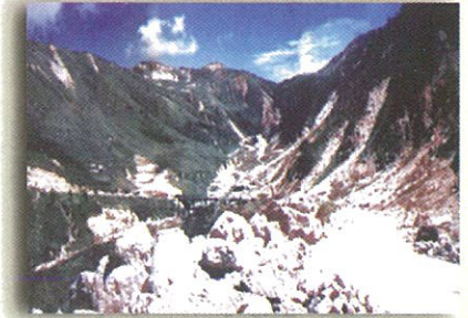
Ang landslide sa Marcos Highway sa Benguet noong Hulyo 16, 1990 ay dulot na pagyanig mula sa lindol.