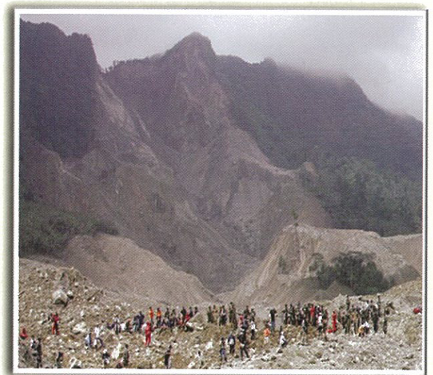
Ang landslide sa Barangay Guinsaugon, St. Bernard, Southern Leyte noong February 2006 ang sinasabing pinakamalaking naitala sa kasaysayan ng Pilipinas.

Ang landslide o pagguho ay ang pagbaha ng lupa, bato, burak at iba pang mga bagay mula sa mataas na lugar nang dahil sa gravity o batak ng natural na magneto ng ating daigdig.